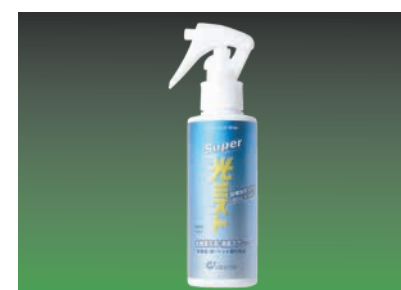
家庭用“ super 光美斯特 ”系列