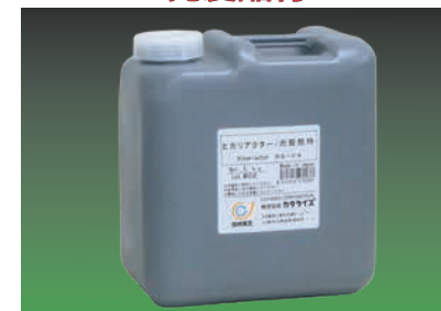
商业用“光爱酷特”系列